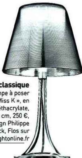
Néoclassique Lampe à poser « Miss K », en polyméthacrylate, H 43 cm, 250 €, design Philippe Starck, Flos sur Lightonline.fr