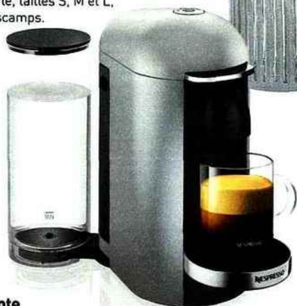
Intelligente Machine à café « Vertuo », coloris argent, équipée d'un lecteur optique pour optimiser paramètres d'extraction, volume et température d'eau, et temps d'infusion, 249 €, Nespresso.