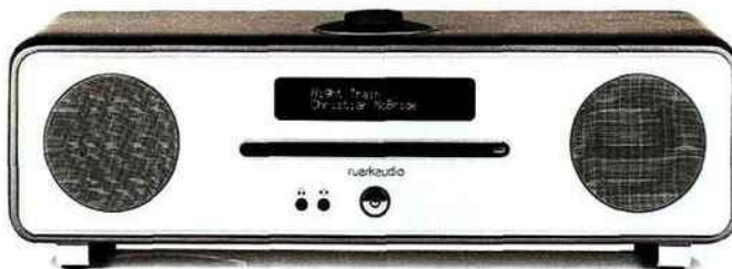
Branchée Radio « R4 » avec système tout-en-un, lecteur CD, bluetooth, Radio FM, finition satinée de titane, H 12,5 x L 44 x P 25 cm, 899 €, Ruark Audio.