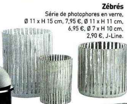
Zébrés Série de photophores en verre, Ø 11 x H 15 cm, 7,95 €, Ø 11 x H 11 cm, 6,95 €, Ø 7 x H 10 cm, 2,90 €, J-Line.