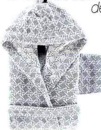
Confortable Peignoir à capuche « Étoilée », en éponge, coloris perle, tailles S, M et L, 159 €, Descamps.