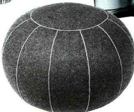
Surpiqué Pouf en laine feutrée, Ø 50 x H 35 cm, 170 €, Broste Copenhagen.