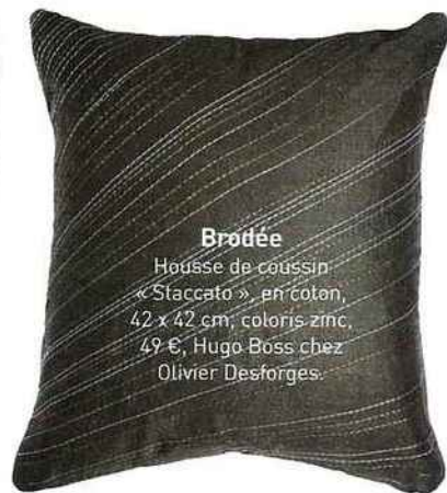
Brodée Housse de coussin « Staccato », en coton, 42 x 42 cm, coloris zmc, 49 €, Hugo Boss chez Olivier Desforges.